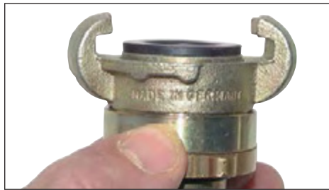
Vorgeschraubte Dichtung - Verbindung ist dicht.