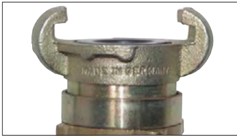
Zurückgedrehte Dichtung - leichtes Kuppeln möglich.